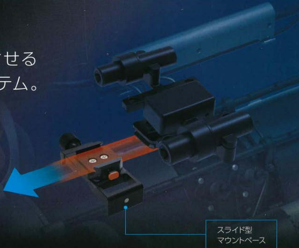
スライド型 マウントベース