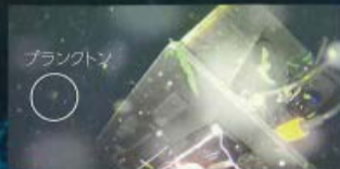
従来のライトアングル