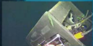
新しいのライトアングル